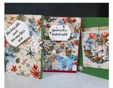
изготовленные в рамках проекта рождественские открытки.

Молодые музыканты и участники песенного клуба составили общую концертную программу, с которой поедут в тур по дневным центрам Таллинна, домам по уходу и больницам по уходу. Первый концерт пройдёт 28 ноября в социальном центре Ласнамяэ. В дневном центре Хааберсти рождественский концерт пройдёт 4 декабря в