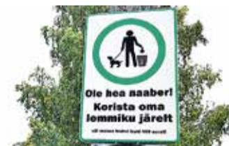
Знак «Убирай за своим питомцем» недалеко от пруда Ыйсмяз.

Уборка за своим любимцем - элементарная вещь. К сожалению, среди нас всё ещё много тех, кому необходимо напоминать об их обязанностях. Понятно, что ни один знак не способен сразу решить проблему, но надеемся, что это даст толчок к изменению ситуации. Установленные перед наступлением зимы знаки призваны напомнить, что рано или поздно снег растает и покрытые снегом кучки станут предметом созерцания для окружа-