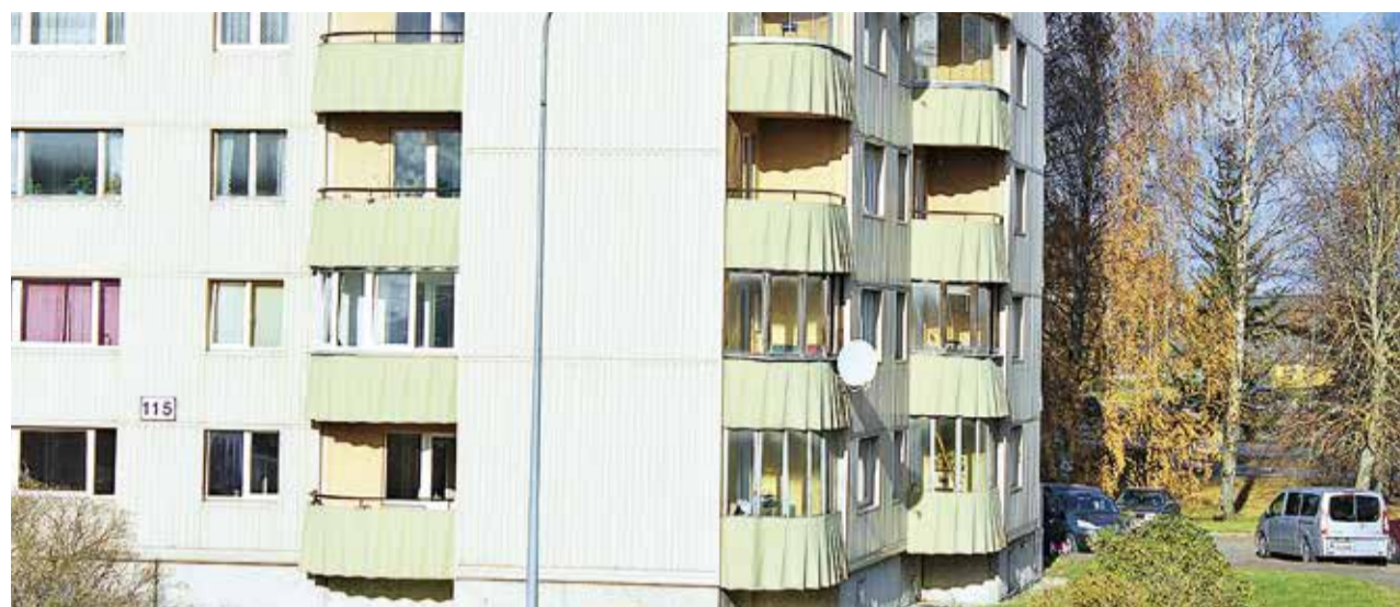
Балконы многоквартирного дома на Эхитаяте теэ.

Он выделил четыре типичные проблемы с балконами: