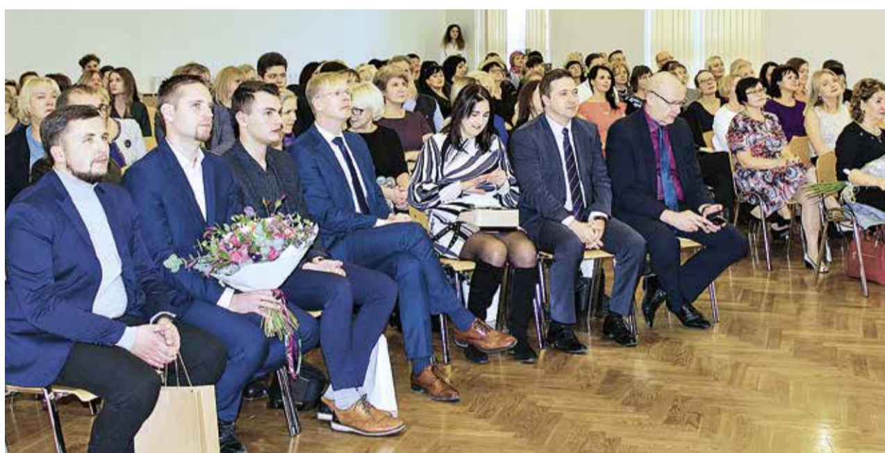
Гимназия Мустыйэ отметила 55 юбилей.

«Гимназия Мустыйэ, которая отмечает свой 55 юбилей получила не менее приятный подарок, школу реконструируют. Снаружи и издали здание выглядит красиво, у школьной семьи уже давно со зда-