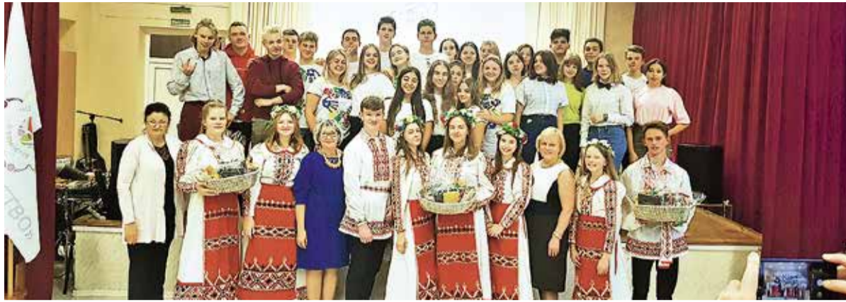
Ученики русской гимназии Хааберсти на фестивале Содружество в Минске

Наша делегация представила жемчужину эстонской культуры –