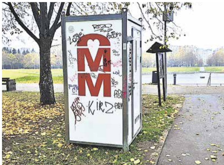
Вандалы изрисовали находящийся на берегу пруда Вяйке-Ыйсмяэ временный туалет.

Старейшина Хааберсти Андре Ханнимяги пояснил, что управа подает на акт вандализма заявление в полицию. «Непонятно, что происходит в головах людей, которые портят нужный и общий инвентарь. Необходимо дать ясный и чёткий сигнал, что такие поступки не останутся без последствий и наказания», - подчеркнул старейшина и призвал жителей поделиться имеющейся