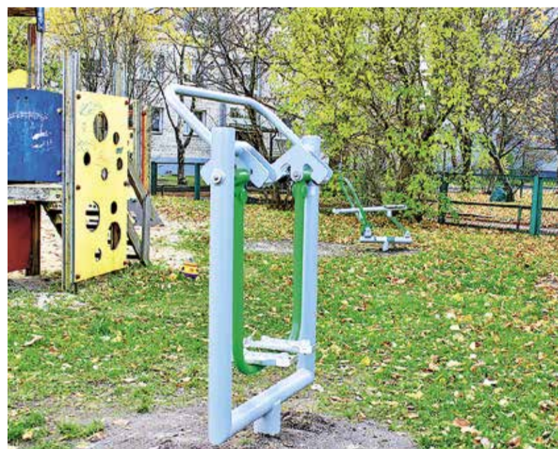
Тренажер возле детской площадки по адресу Пирни 2.