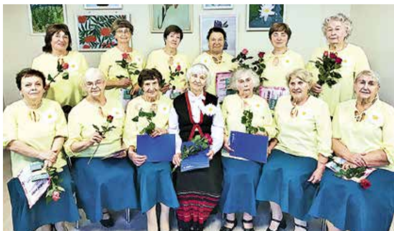
Танцевальная группа пожилых Карикаар.

Призы были предоставлены клубом MyFitness, АМВ Академия боулинг, смути Pombel, бассейном Ыйсмяэ, НКО спортивного клуба RIM и управой Хааберсти. Центр досуга Хааберсти ещё раз поздравляет победителей и благодарит всех участников и партнёров состязания.