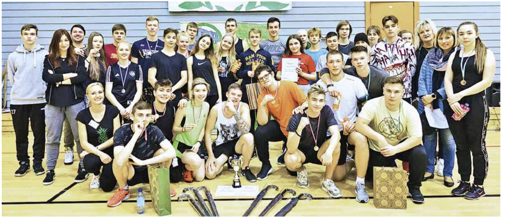
Общая фотография участников соревнований.

4.12 в 14.00 Рождественское приветствие ансамбля НоВа. Выступают солистов музыкального агентства Эды Захаровой под руководством Катрин Кеерма.