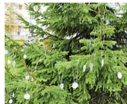
Елка с отражателями на Астангу.

Молодёжный полицейский Пыхьяской префектуры Ляэне-Харьюского отделения полиции Яаника Яаласт выразила надежду,